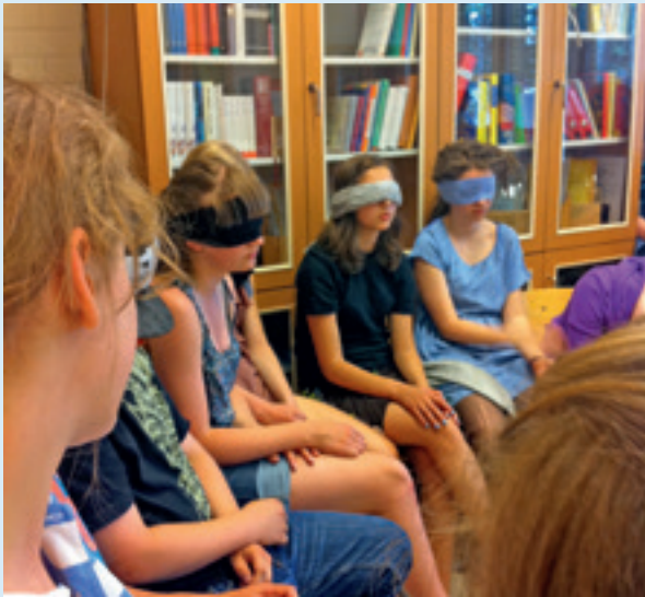
Gblinddoekt voor boekenkast

curriculum, de didactiek, de organisatie, de toetsing of de inleverdata. De manier waarop wij onderwijs aanboden kon kwetsbare jongeren over de rand duwen, maar dat durfden maar heel weinig docenten en managers onder ogen te zien. Sterker, er werd soms heel schamper gedaan over die 'tere zielen' die niet beschikten over de juiste 'coping skills' .