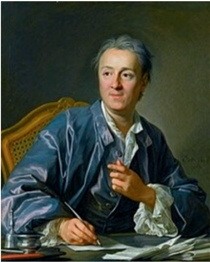
Denis Diderot by Louis Michel van Loo