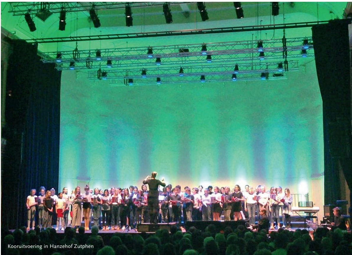
Kooruitvoering in Hanzehof Zutphen

eens niet lekker in je vel zit, kun je muziek opzetten die dat versterkt, maar je kunt ook leren muziek op te zetten die je er uit haalt. En als er in de groep een leerling is die emotioneel wordt, dat heb je elk schooljaar wel eens, dan deel ik dat het helemaal niet erg is, omdat muziek dat nu eenmaal met ons kan doen. Dat gebeurt ook wel eens in de klas, bij het stemtesten bijvoorbeeld; wij testen leerlingen per drie, welke stemsoort zij hebben en daarbij is er wel eens een leerling die zijn stem niet kan vasthouden. Dan is het belangrijk dat er een veilige omgeving is, dat we in kleinere groepjes zijn.’